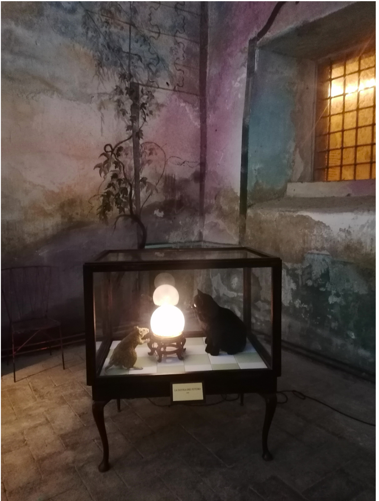
LA FANTASIA DEL FUTURO